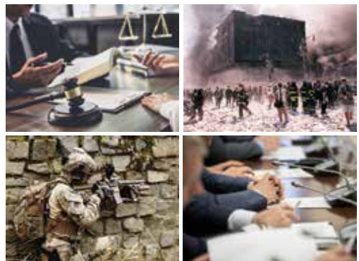
Welke foto's passen bij debat en welke foto's passen bij strijd?

Een nadeel van een debat kan zijn dat het heel lang duurt. 2 oplossingen daarvoor zijn de meerderheidsregel en de rechter. - De meerderheidsregel houdt in dat er aan het eind van een debat gestemd wordt. De meerderheid bepaalt dan wat er gebeurt. - De oplossing van de rechter houdt in dat een rechter de beslissing mag nemen als 2 partijen er samen niet uitkomen.